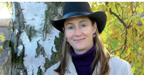
Pfarrerin, Western-Trainerin C (EWU)