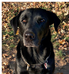
Pfarrhund & Bodos Assistent