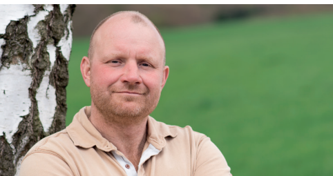
Lizenzierter Parelli Instruktor (3 Sterne)

Auf dem Birkenhof bieten wir die idealen Voraussetzungen, um in der Mensch-/Pferd-Beziehung eine beidseitige Entwicklung zu fördern. Dank unserer großen Herde mit ausgeglichenen Pferden, können wir Workshops für Menschen in hoher Zahl und ohne eigene Pferde anbieten. Die eigenen Lieblinge sind bei uns selbstverständlich, nach vorheriger Absprache, auch gerne willkommen.