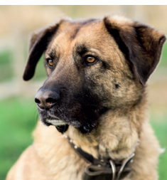
Dogmanship Instruktor (5 Sterne)